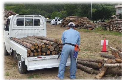
↑持ち込んだ材を荷降ろし (模擬開催参加者②)