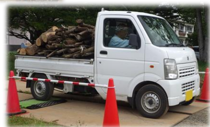
持ち込んだ材を計測 → (模擬開催参加者①)